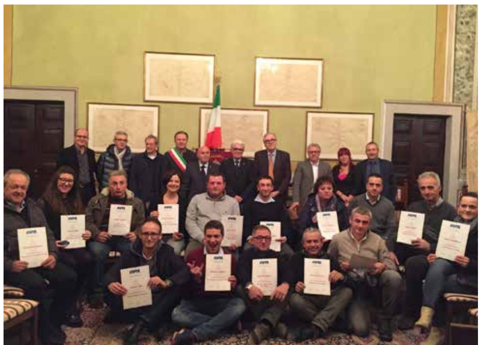
I donatori premiati a fine 2018